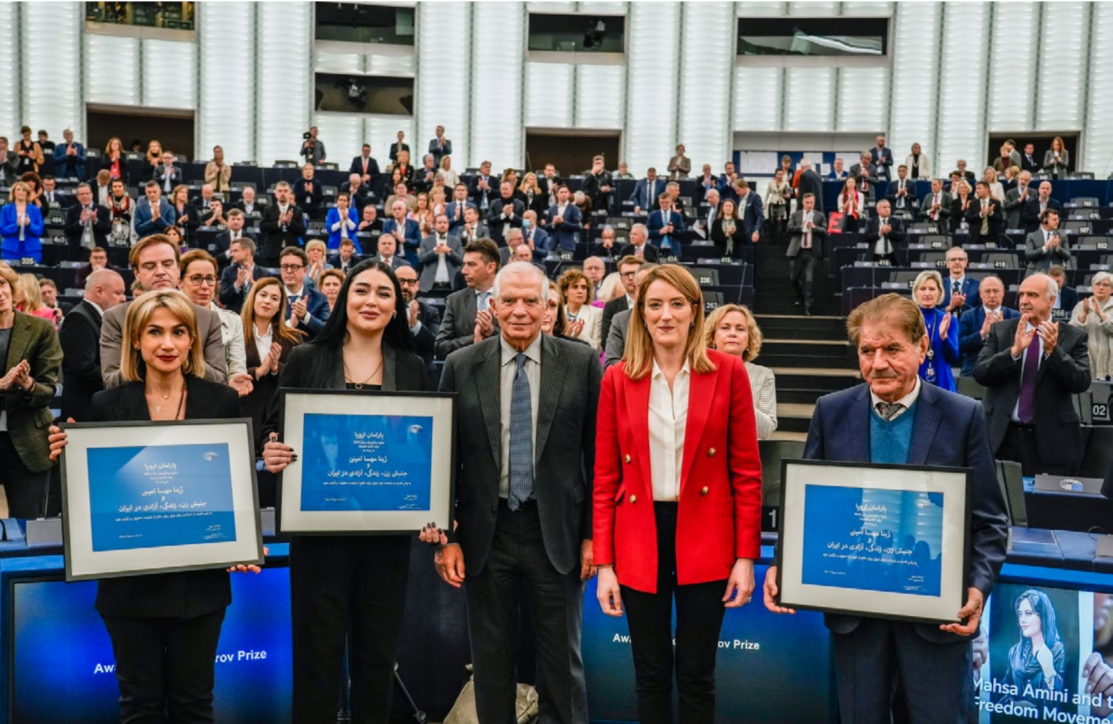
▶ ENTREGA DEL PREMIO SÁJAROV 2023