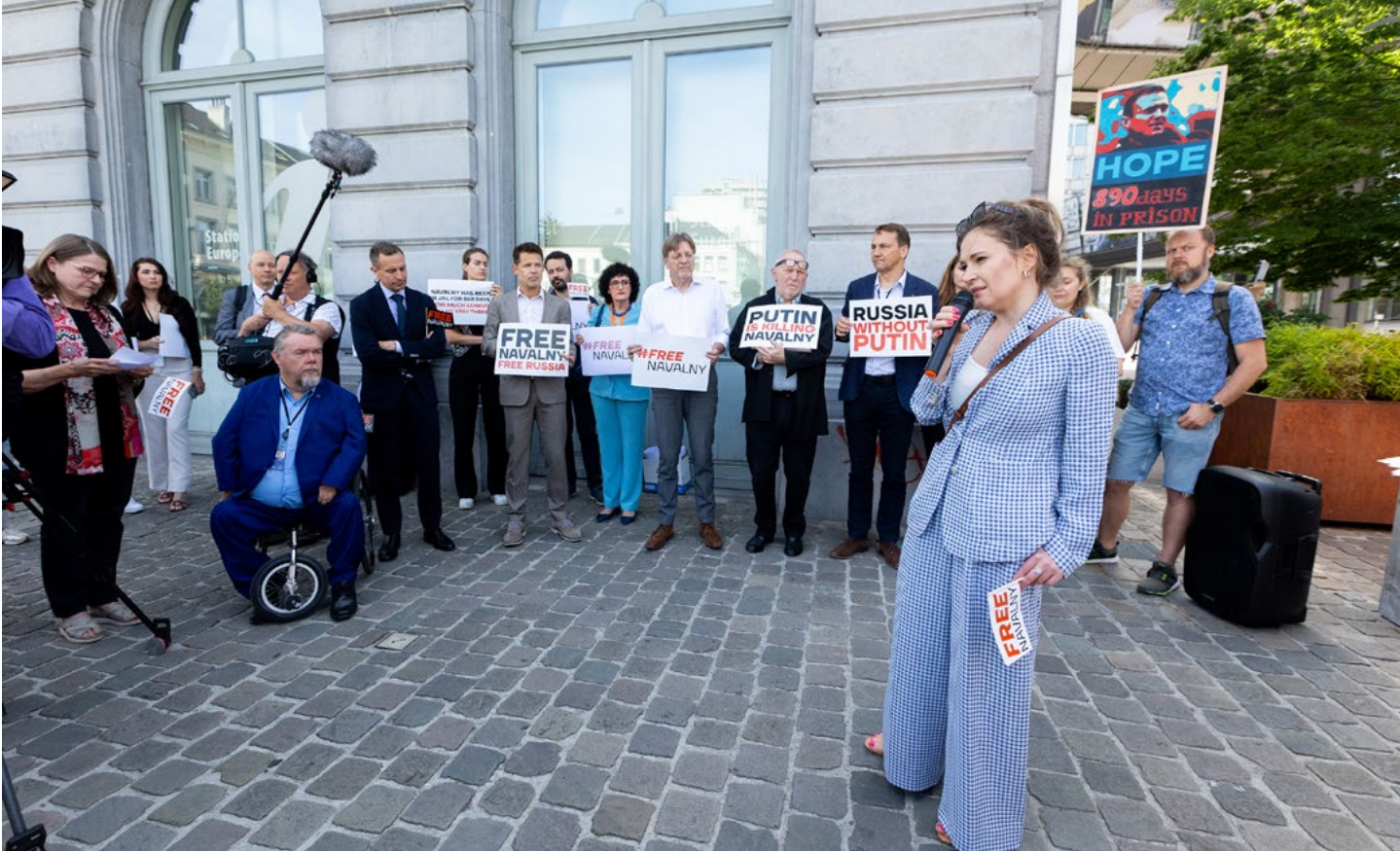
► EXHIBICIÓN DE LA CELDA DE NAVALNI