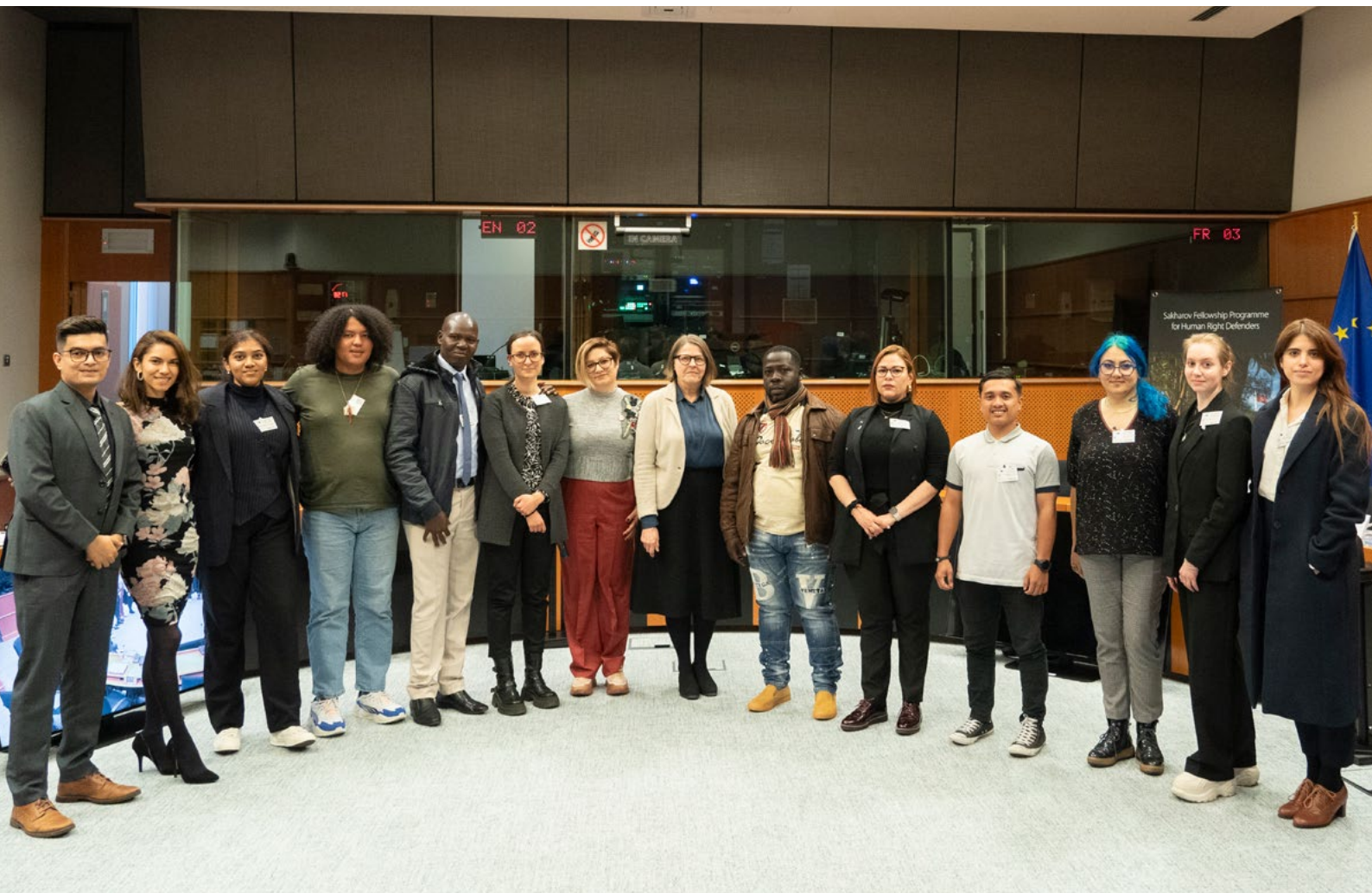
▶ PARTICIPANTES EN EL PROGRAMA SÁJAROV 2024 CON LA VICEPRESIDENTA HEIDI HAUTALA

A través de su Programa Triángulo para la Democracia , los diputados acompañan a los Parlamentos socios a la hora de reunir a los legisladores, la sociedad civil y los agentes de los medios de comunicación para luchar contra la desinformación y, al mismo tiempo, proteger de la libertad de expresión.