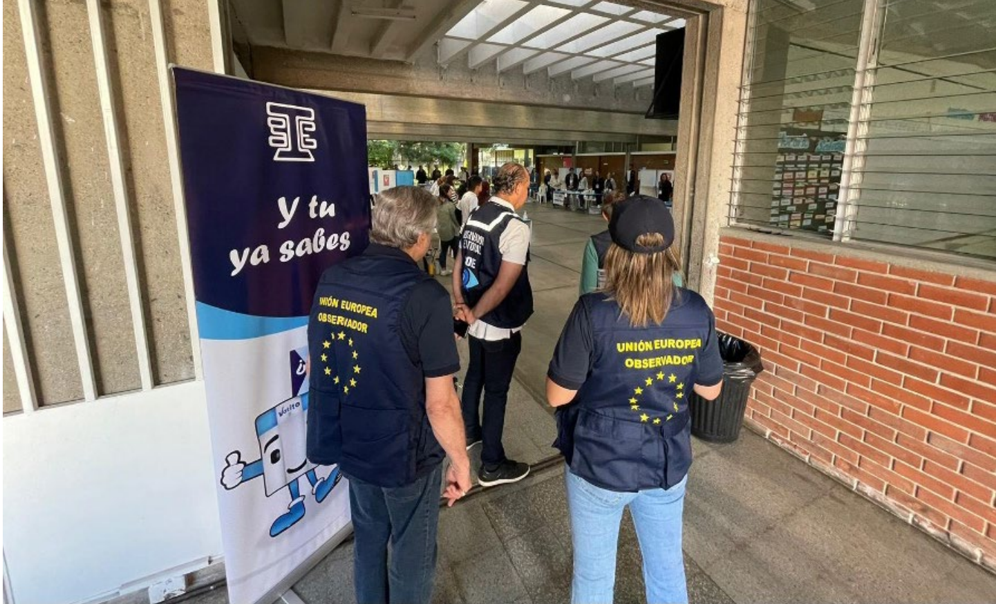
► MISIÓN DE OBSERVACIÓN ELECTORAL, GUATEMALA, 2023